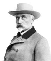
VIGGO HØRUP (1841-1902) STIFTER AF POLITIKEN I 1884