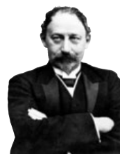
EDVARD BRANDES (1847-1931) STIFTER AF POLITIKEN I 1884